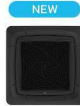
หน้ากากสีดำ PB-950KB(B)