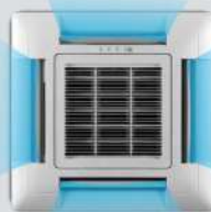
4 way airflow

มีสไลด์ด้วยระบบกระจายความเย็นรอบตัวทำให้สบายทุกมุมห้องโดยไร้จุดอับความเย็น หน้ากากขนาด กxลxส 950x950x60 (25-60k)