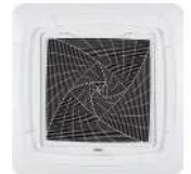
หน้ากากสีขาว PB-950KB