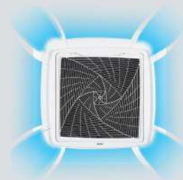
Unique round way air flow design